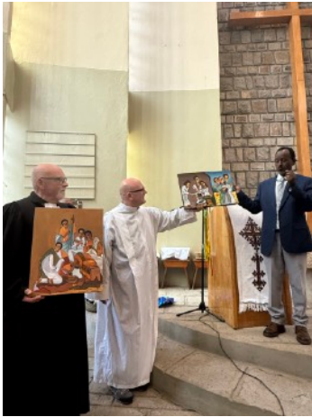
Geschenkübergabe im Gottesdienst

Danach besuchten wir das Adwa-Museum, das an die berühmte Schlacht von Adwa erinnert, in der Äthiopien 1896 die italienischen Kolonialtruppen besiegte. Die Ausstellung zeigte historische Waffen, Uniformen und sogar das erste äthiopische Flugzeug. Auf den Straßen rund um das Museum waren bereits die Vorbereitungen für die großen Feierlichkeiten zum Adwa-Gedenktage am nächsten Tag zu sehen.