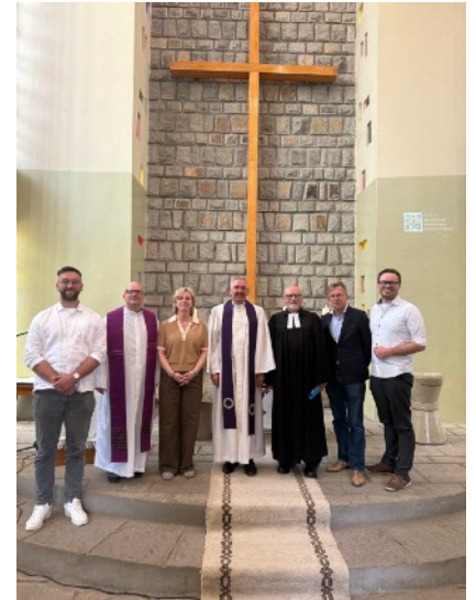
Treffen der beiden Kirchengenossen nach dem Gottesdienst

Unser nächster Halt war die Holy Trinity Cathedral. Dort befindet sich das Grab von Kaiser Haile Selassie. Rund um die Kirche liegen zahlreiche weitere Grabstätten bedeutender Persönlichkeiten des Landes. Auch hier wurden bereits Flaggen aufgestellt und Podeste aufgebaut, da am folgenden Tag offizielle Feierlichkeiten stattfinden sollten.