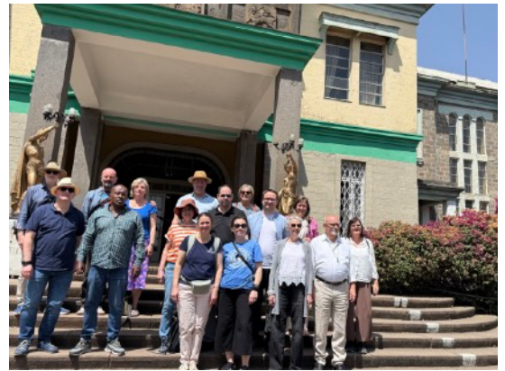
Gruppenfoto vor dem ethnologischen Museum

Anschließend fuhren wir zur Universität von Addis Abeba und besuchten dort das ethnologische Museum, das sich im ehemaligen Wohnsitz Kaiser Haile Selassies befindet. Die Ausstellung bot spannende Einblicke in die Geschichte und Kultur Äthiopiens: traditionelle Kleidung, Waffen, Musikinstrumente und viele historische Zeugnisse.