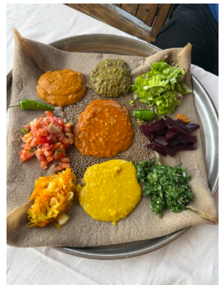
Äthiopisches Nationalgericht: Injera

Am Abend trafen wir uns noch einmal zu einem gemeinsamen Abschlussessen, bevor es schließlich zum Flughafen ging. Von dort traten wir die Rückreise nach Deutschland an – mit vielen neuen Eindrücken, Begegnungen und Erfahrungen aus einem faszinierenden Land.